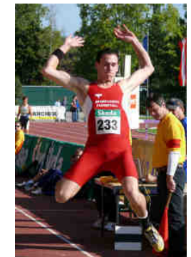
Dominik Distelberger