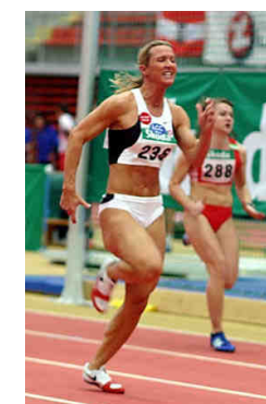
Bettina Müller-Weissina © ÖLV