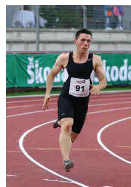
Roland Kwitt © ÖLV