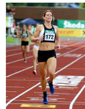
Sabine Kreiner © ÖLV