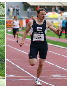
Clemens Zeller © ÖLV