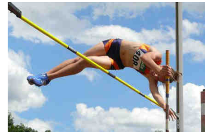
Kira Grünberg © Wiederin