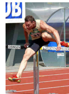
Elmar Lichtenegger