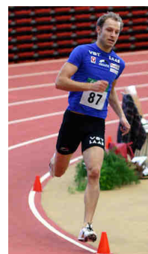
Andreas Rapatz © ÖLV