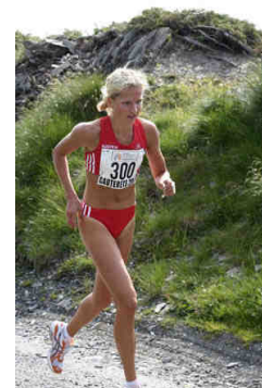
Anita Baierl © Lilge