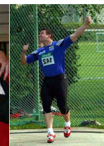
Gerhard Mayer © ÖLV