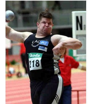
Christian Pirmann © ÖLV