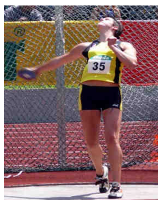
Veronika Watzek © ÖLV