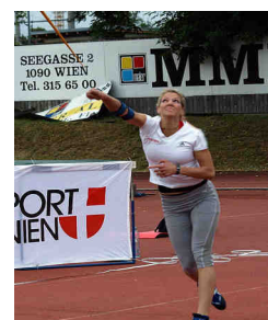
Elisabeth Pauer © ÖLV