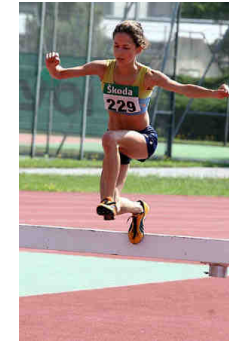
Tanja Eberhart © Weiss