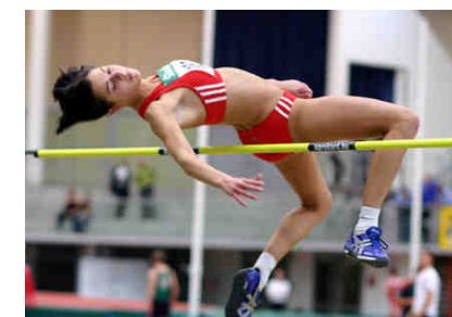
Monika Gollner © ÖLV