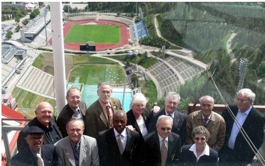
The WMA Council on the occasion of the WMA Council Meeting, Lahti, FIN. June 2008.

Clockwise from left to right, starting from the rear: