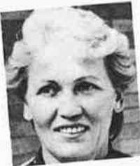
Die Präsidentin des Österreichischen Leichtathletik-Verbandes

Amsterdam war für die europäische Leichtathletik nicht nur der Ort für wichtige Beschlüsse. Der Europarat, in dem ich Mitglied bin, tagte in Permanenz. Die Kalenderkonferenz, die einmal auch schon in Österreich (Linz) stattfand, machte die Zusammenkunft (Linz) stattdessen, machte die Zusammenkunft darüber hinaus zu einem bunten Markt, zu einer richtigen Leichtathletikmesse. In immer mehr Ländern wachsen internationale Meetings aus dem Boden. Alle wollen zeigen, wie attraktiv und faszinierend unsere vielgestaltige Leichtathletik sein kann. Darum wird die Koordination zwischen den IAAF- und den EAA-Veranstaltungen sowie privaten Meetings auch immer schwieriger. Auf der anderen Seite müssen die europäischen Verbände ihre Veranstaltungen wie Länderkämpfe, Europacups etc. so terminisieren, daß die jungen Athleten an ein hohes Leistungsniveau herangeführt werden können.